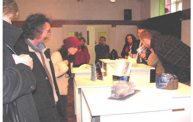
De nombreux visiteurs sont venus au stand lors de la biennale du Design

Du 15 au 22 novembre, dans le cadre de la biennale du Design de Saint-Etienne, une exposition " en verres libres " a été faite à la verrerie de Saint-Just-Saint-Rambert. En plus des œuvres d'une dizaine d'artistes (vitrail, verre soufflé, verre optique taillé, verre gravé, pâte de verre estampée ou verre filé) un aspect historique de la verrerie était présenté.