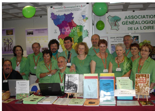
Toute l'équipe de l'AGLoire présente à Grenoble

Le troisième forum régional de généalogie s'est tenu dans les locaux d'ALPEXPO à Grenoble. Une cinquantaine d'exposants (associations généalogiques, associations d'histoire locale et professionnels du monde généalogique) étaient présents.