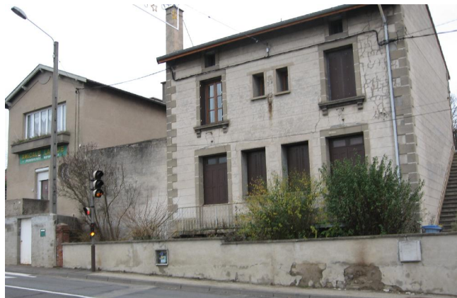
Nouveau local pour l'antenne d'Unieux "la Croix de Marlet" 21 rue Ambroise Paré

Les horaires et les dates prévus au mois de juin sont maintenus jusqu'en juin 2009.