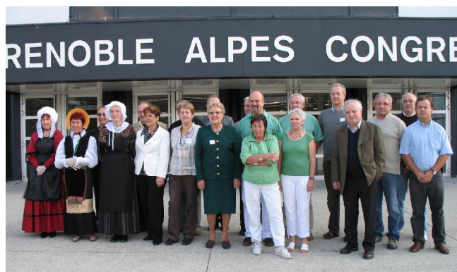
Présidents et vice-présidents des associations participantes à ce 3 ème congrès régional.

L'AGLoire a tenu un stand qui s'est fait remarquer puisque, pour l'occasion, les administrateurs présents arboraient une chemisette verte, ce qui n'est pas passé inaperçu. Nous avons eu une bonne affluence car de nombreux adhérents ligériens avaient fait le déplacement dans le Dauphiné. Nous avons eu également la visite d'adhérents locaux et de généalogistes débutants ayant des ancêtres dans notre secteur. Félicitations au Cercle Généalogique du Dauphiné pour l'organisation de ce forum. Le prochain, en 2010, devrait se dérouler en Savoie ou Haute-Savoie.