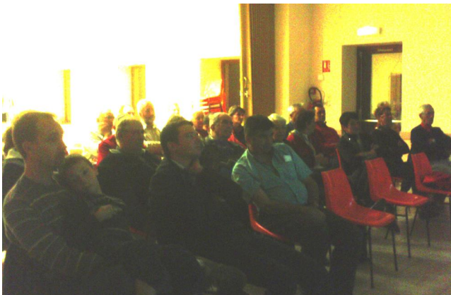
Une quarantaine de personnes ont assisté à cette conférence.